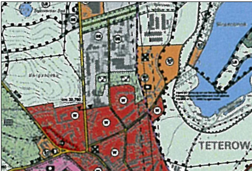
Abbildung: Ausschnitt des gültigen Flächennutzungsplanes

Das Plangebiet wird im gültigen Flächennutzungsplan als 'Wohnbaufläche' (W) dargestellt, so dass die vorliegende Planung dem Gebot des § 8 Abs. 2 BauGB, wonach Bebauungspläne aus dem Flächennutzungsplan zu entwickeln sind, entspricht.