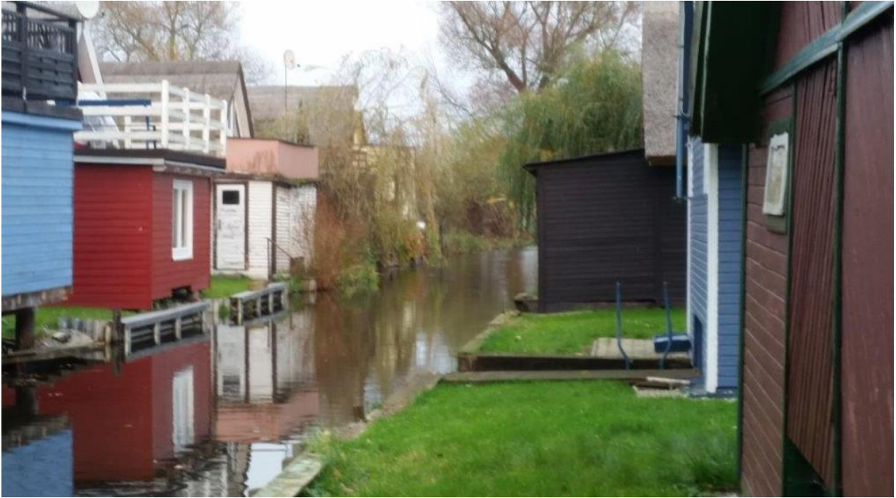
Abbildung 8: Rückwärtige Gebäudefronten. Sowohl mit Abstand zur Wasserkante, als auch direkt an den Kanal heranreichend. 2/2017

Die Bootshäuser sind nur zulässig innerhalb der festgesetzten Baugrenzen und auf den Baulinien. Auch die Außenkante der Dachtraufen muss innerhalb der Baugrenzen verbleiben. Das bedeutet, dass die Seitenwände der Bootshäuser um das Maß der Dachüberstände (Tiefe Außenkante Dach bis aufsteigende Wand) hinter die Baugrenzen zurücktreten müssen.