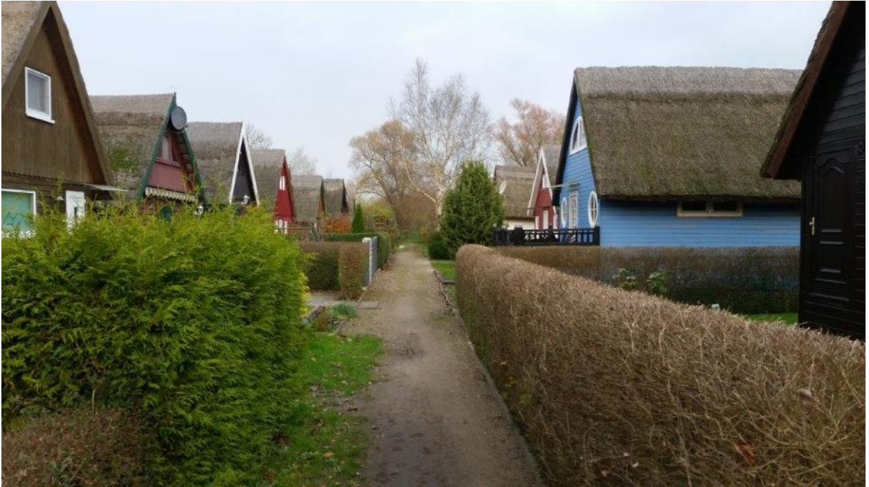
Abbildung 3: Fußweg zwischen den Bootshäusern, 11.2017

Von den Fußwegen gelangt man jeweils über einen Vorgartenbereich an die vorderen Eingangstüren in den Erdgeschossen.