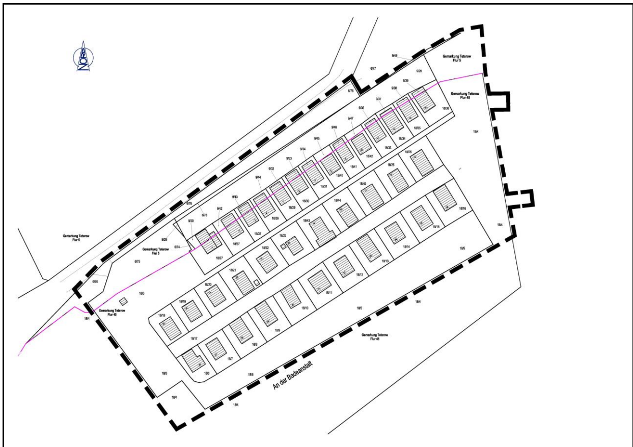
Abbildung 1: Geltungsbereichsgrenze des Bebauungsplans Nr. 64 gem. § 9 (7) BauGB

Dritte Hauszeile: Flur 45 18/6, 18/7, 18/8, 18/9, 18/10, 18/11, 18/12, 18/13, 18/14, 18/15, 18/16.