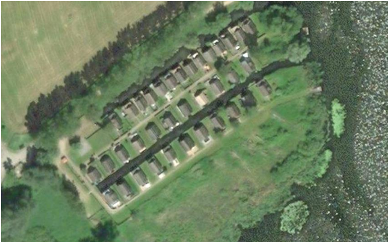
Abbildung 2: Luftbild Bootshauskolonie 1, Teterow.

Es handelt sich um ein Vereinsgelände, das grundbuchlich für jedes Bootshaus-Grundstück parzelliert ist. Die Größen der Parzellenflächen variieren.