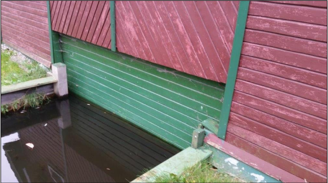
Abbildung 6: Funktionsfähige Zufahrt/Wassertor zum Bootshaus. 11/2017

Die Zulässigkeit des Aufenthaltes im Rahmen der privaten Erholung durch die Nutzer ist auch mit der Möglichkeit zu übernachten, zu kochen und für das Verbringen von Freizeit verbunden. Das ergibt sich aus der ursprünglich angelegten Nutzungsart und dem städtebaulichen Willen der Stadt, dieses Angebot zu erhalten.