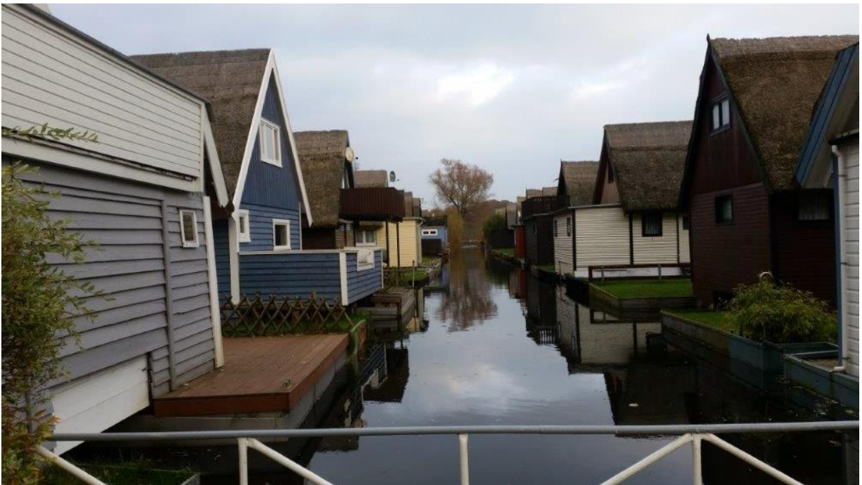
Abbildung 4: Stichkanal und rückwärtig anliegende Bootshäuser, 11.2017

In das Gebiet führen 2 Stichkanäle des Teterower Sees.