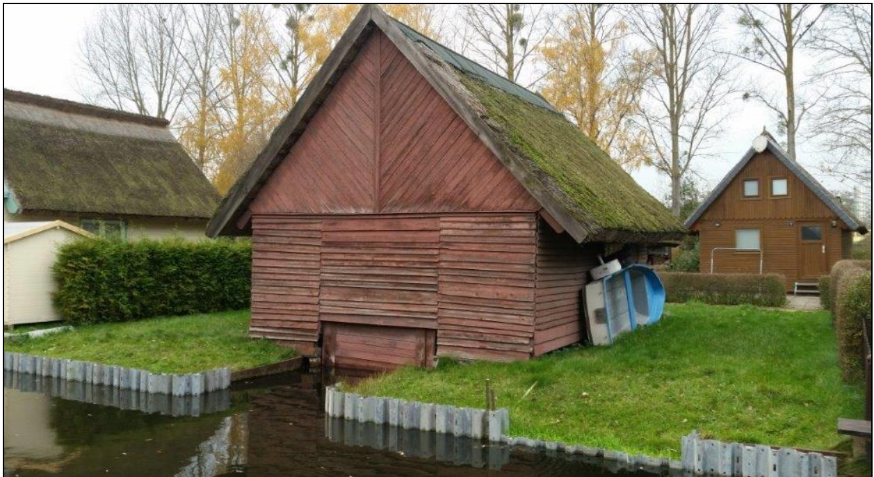
Abbildung 5: Hausnummer 21, weitgehend originaler Errichtungszustand, Rückseite

Die Grundflächen der Gebäude betragen zwischen ca. 27 m 2 (Nr. 20) und bis zu ca. 70 m 2 bei erweiterten Gebäuden (Nr. 19). Gebäude im weitgehenden Originalzustand (Nr. 21) haben eine Grundfläche von ca. 40 m 2 .